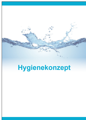
Auszug aus der Hygiene-Schulung